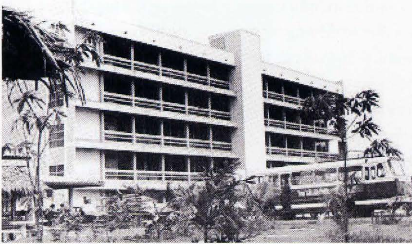
ภาพอาคารเรียนหลังแรกของ ABAC ที่หัวหมาก

ความวุ่นวายภายใน ACC และ ABAC เป็นอย่างมาก เมื่อปัญหาเริ่มมากขึ้น ในเดือน เมษายน พ.ศ. 2517 (ค.ศ. 1974) ภาควิชาสังคมศาสตร์ที่ริวานนท์ ซึ่งเป็นอธิการ ABAC ในขณะนั้น จึงลาออก